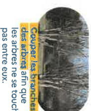
Couper les branches des arbres afin que les arbres ne se touchent pas entre eux.