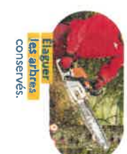
Élaguer les arbres conservés.