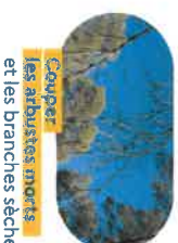
Couper les arbustes morts et les branches sèches.